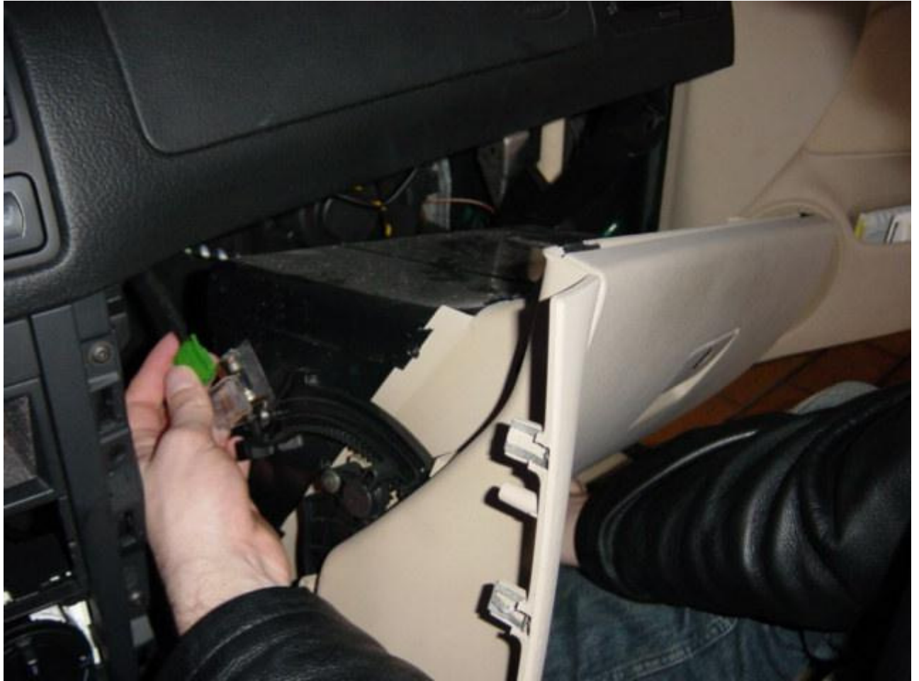
Plastikverkleidungen unterhalb des Lenkrades entfernen: