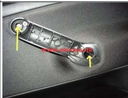
Die beiden darunterliegenden Schrauben ausdrehen