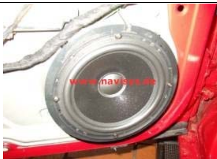
Tieftöner an den Steckern des Adapter anstecken und mit 4 Schrauben am Distanzring verschrauben