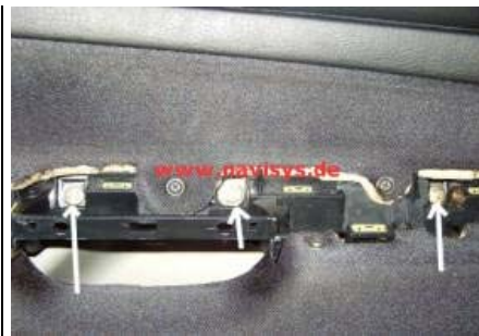
Die 3 Schrauben unter dem Bedienpaneel ausdrehen (nur Fahrertür)