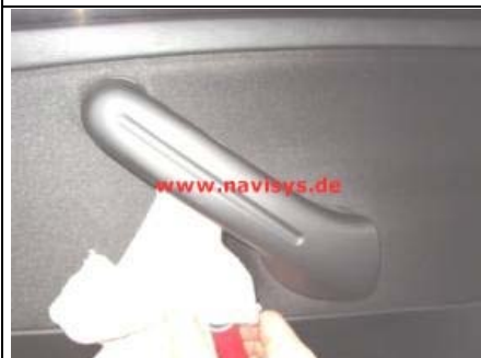
Beifahrertür und Fond-Türen: Die Griffabdeckung mit einem flachen Schraubendreher aushebeln (mit Lappen umwickeln um keine Kratzer oder Druckstellen zu erzeugen)