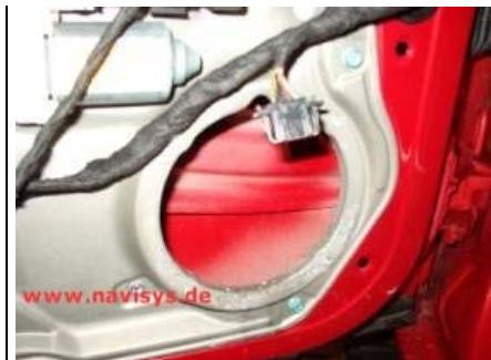
Tieftöner abnehmen, ggf. etwas mit einem flachen Schraubendreher nachhebeln. Überstehenden Nietreste soweit wie möglich abbohren und Reste mit Hammer und Durchschlag austreiben. Nietreste aus dem Türinnenraum entfernen.