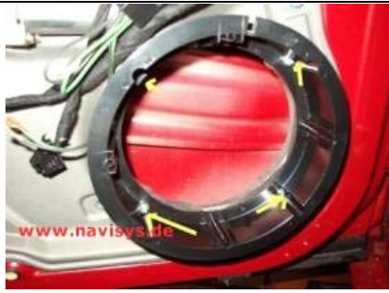
Distanzring aufsetzen und mit 4 Schrauben/Muttern/Federscheiben M5 an der Tür verschrauben