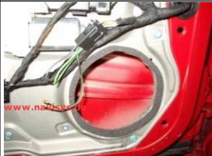
Adapterstecker am Serienstecker aufstecken Dichtband auf der Tür um das Loch aufkleben