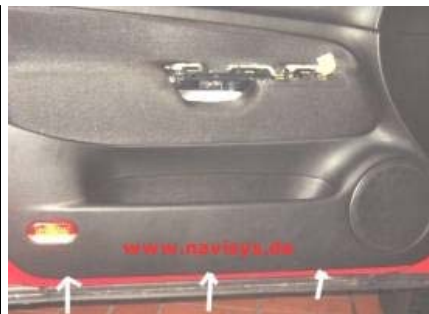
3 Schrauben an der Unterkante der Türverkleidungen ausdrehen (Fond-Türen nur 2 Schrauben)