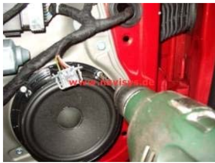
Stecker oben am Tieftöner entriegeln und herausziehen. Die 4 Nietenköpfe am Flansch des Lautsprechers abbohren