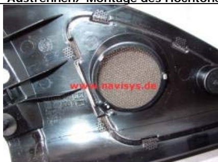
Alten Hochtöner entnehmen