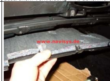
Verkleidung Richtung Fahrersitz herausziehen.