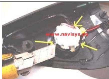
die 3 Schmelznasen am Hochtöner mit einem scharfen Messer abtrennen oder z.B. mit einem Drehmel abschleifen