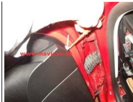
1 Schraube an der vorderen Kante der Türverkleidung ausdrehen (nur Vordertüren)