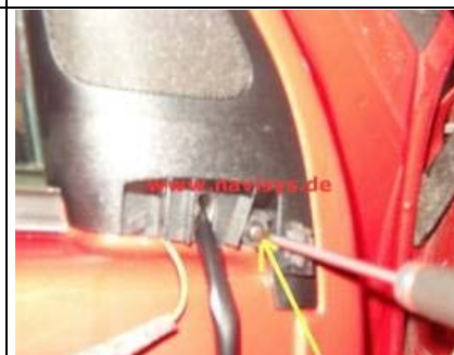
Nur Vordertüren: Schraube aus dem Spiegeldreieck ausdrehen.