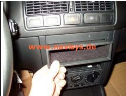
Fach herausnehmen um zusätzlichen Platz zu bekommen