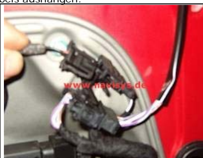
Stecker des Hochtöners entriegeln und herausnehmen. Spiegeldreieck abnehmen