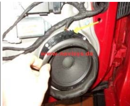
Manschette des Tieftöners abnehmen