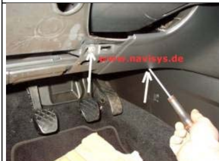
Schrauben der rechten Fahrerfußraumverkleidung ausdrehen und Verkleidung abnehmen