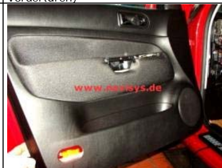
Verkleidung von unten aus den Clips an der Tür herausziehen und dann nach oben aus der Fensterführung herausdrücken. Alle Kabelverbindungen abziehen