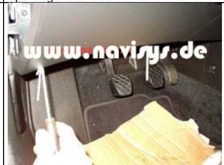
Beide Schrauben unten aus der Verkleidung im Fahrerfußraum links ausdrehen. Verkleidung links abnehmen