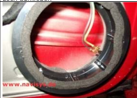
Dichtband schräg auf die Innenkante des Distanzringes aufkleben