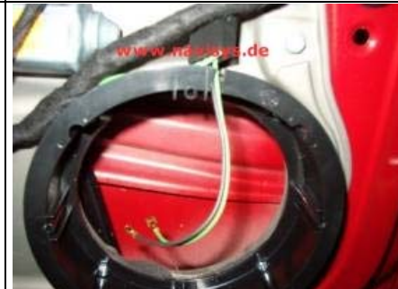
Die freien Enden des Adapters durch den Spalt in den Distanzring legen.