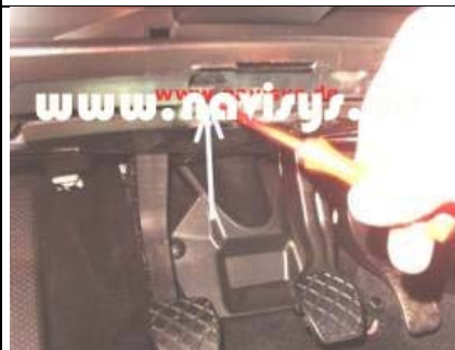
Clip an der unteren Fußraumverkleidung mit Schraubendreher entriegeln