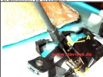
Zug aus dem Türöffner aushängen: Haken A aus Halterung aushaken Zug nach hinten ziehen und aus der Führung nehmen, Haken B aus der Öse des Entriegelungshebels aushängen.