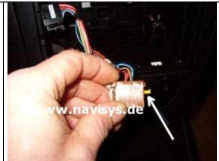
Seitlich am Radiostecker den gelben Sperrriegel aushebeln und herausziehen