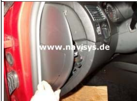
Seitenabdeckung der Amaturentafel links abnehmen