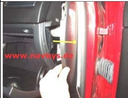
Seitenabdeckung der Amaturentafel rechts abnehmen