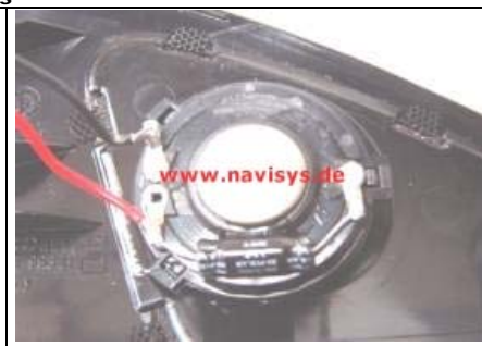
Neuen Hochtöner mit den 3 Laschen auf die 3 Stummel der Schmelznasen aufsetzen und mittels Heißkleber oder schnellhärtendem 2-K Klebstoff fixieren.

Spiegeldreieck wieder montieren, Stecker am Serienstecker aufstecken. Türverkleidung wieder montieren.